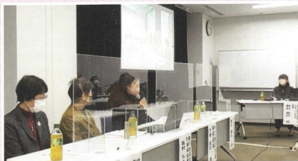
▲パネルディスカッションの様子

地(学)区社会福祉協議会の皆さまが地区社協活動拠点での取組を進められるうえで、本研修が今後の活動の参考になれば幸いです。