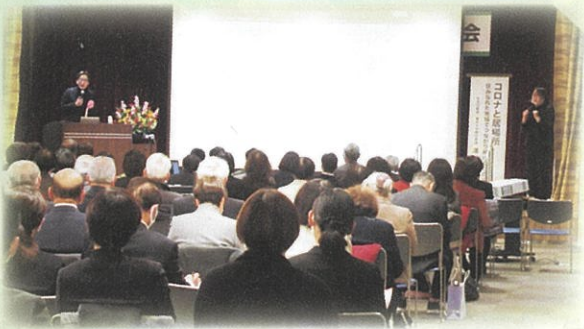
▲湯浅氏による講演の様子

令和4年12月21日(水)、広島市総合福祉センターにて広島市社会福祉大会を開催しました。今年度は個人328名と27の団体が表彰を受けられました。受賞された皆さま、おめでとうございます。